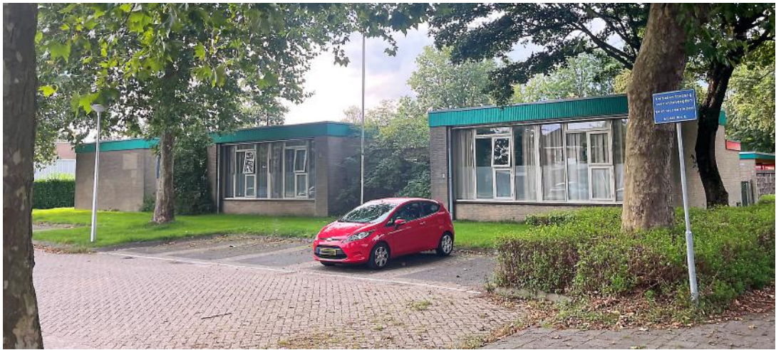
DE LEEGSTAANDE SCHOOL IN IJSSELSTEIN

“Via de Thuisgevers kunnen we ook van andere gemeenten leren.”