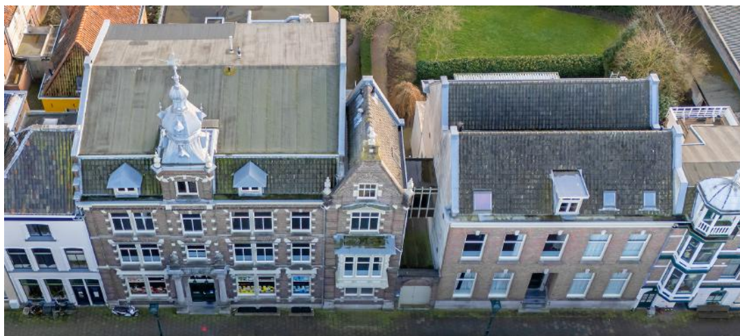
HET GEBOUW VAN DE THEOLOGISCHE UNIVERSITEIT IN KAMPEN

HOTEL • BEDRIJFSPAND • PASTORIE • SCHOOL • KANTOOR